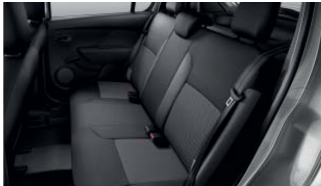
Banqueta trasera con reposacabezas