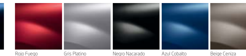
Rojo Fuego Gris Platino Negro Nacarado Azul Cobalto Beige Ceniza