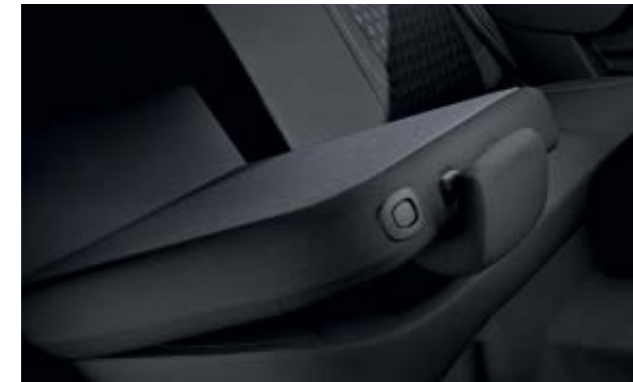
Banqueta trasera abatible 1/3 - 2/3