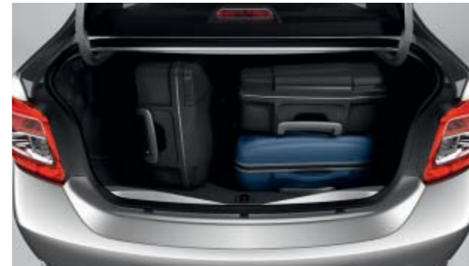
Capacidad del maletero de 51.0L