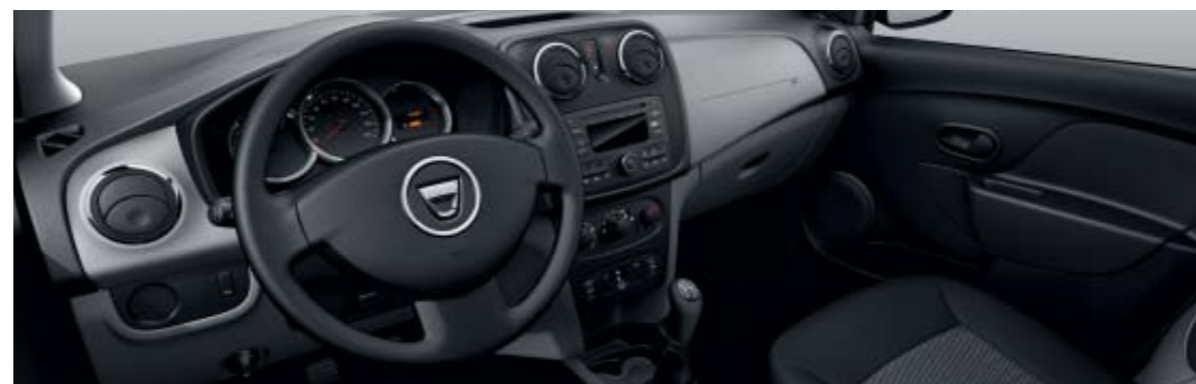
Aire acondicionado y Dacia Plug&Radio de serie.