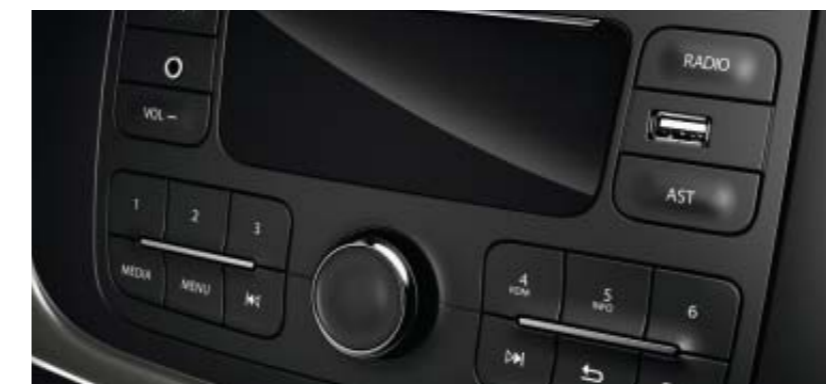
Dacia Plug&Radio (radio CD MP3, Bluetooth® y toma Jack y USB).